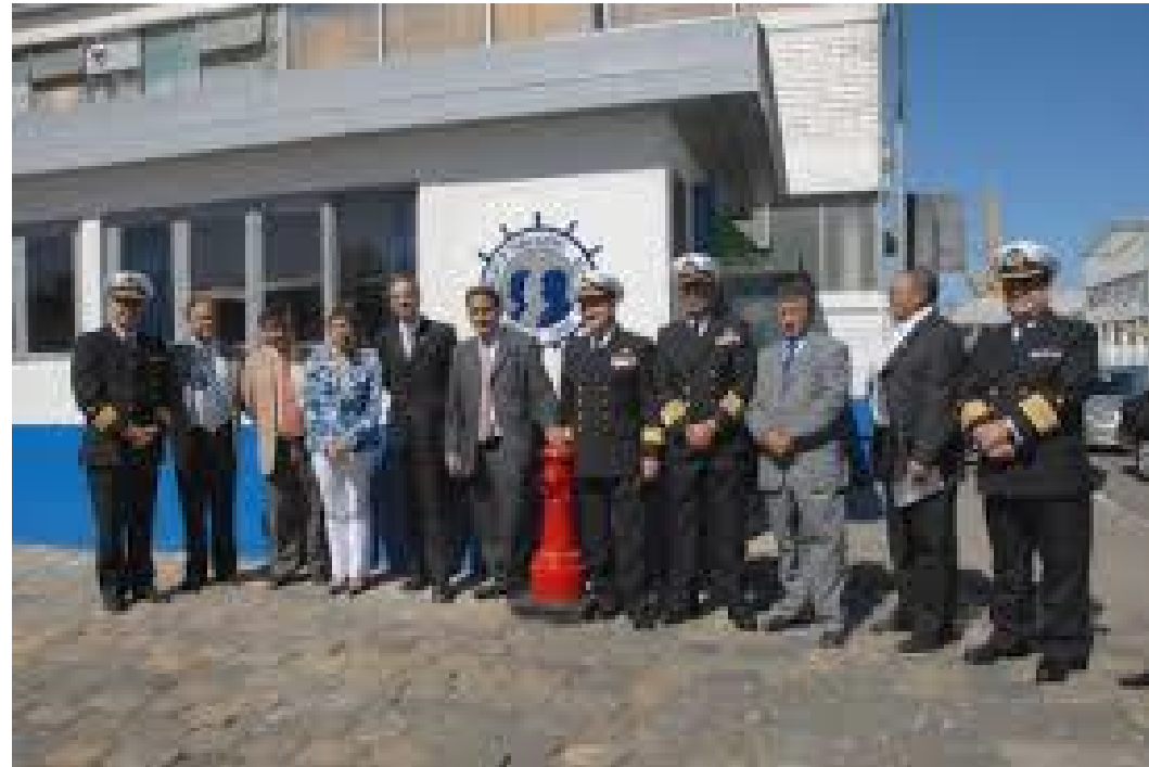
Inauguración de Oficina Sindical al Interior de Asmar